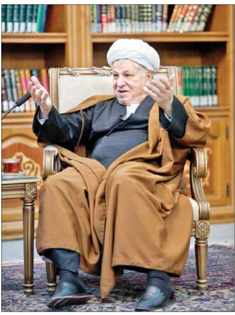
عباس، عباس کزوری شرق