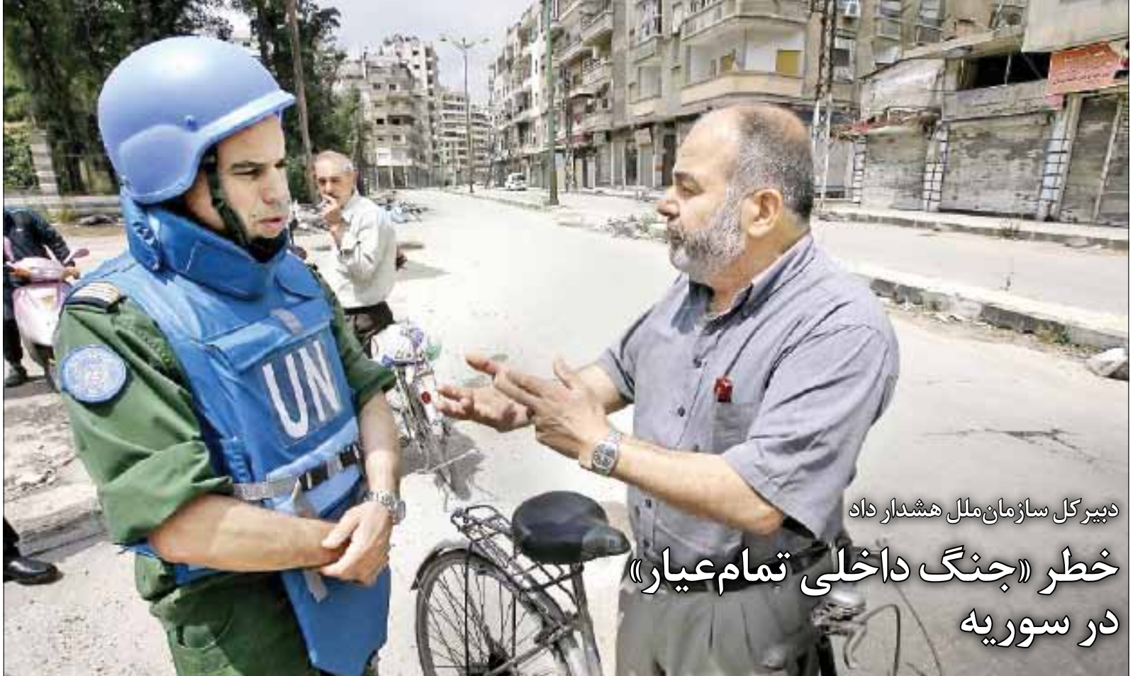
دبیر کل سازمان ملل هشدار داد

کدخدایی: رئیس‌جمهور براساس اصل ۱۱۳ نمی‌تواند به شورای نگهبان و نهادهای خارج از قوای سه‌گانه، تذکر و اخطار دهد